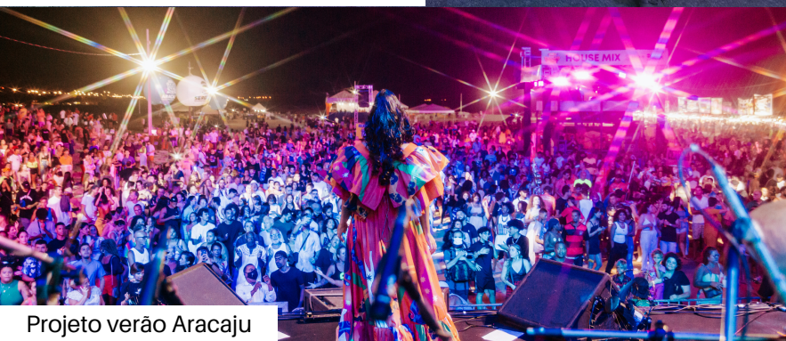
Projeto verão Aracaju