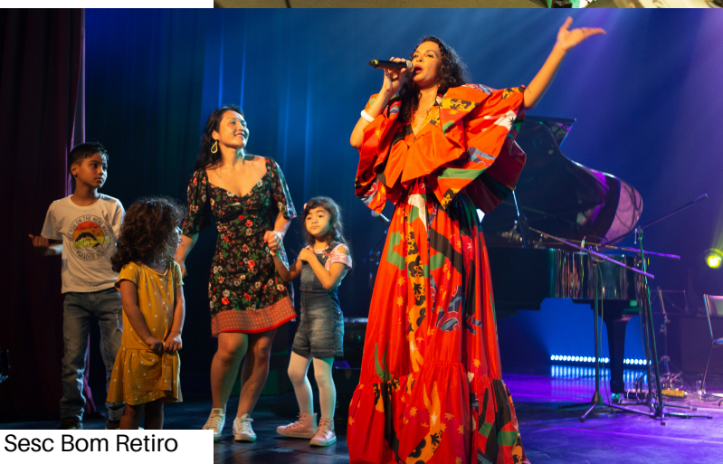
Sesc Bom Retiro