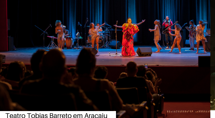
Teatro Tobias Barreto em Aracaju