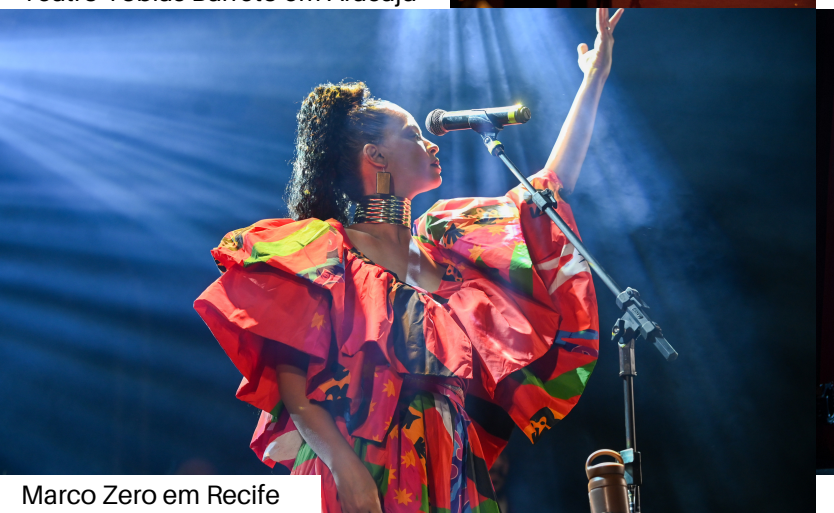
Marco Zero em Recife