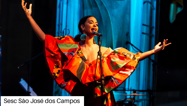
Sesc São José dos Campos