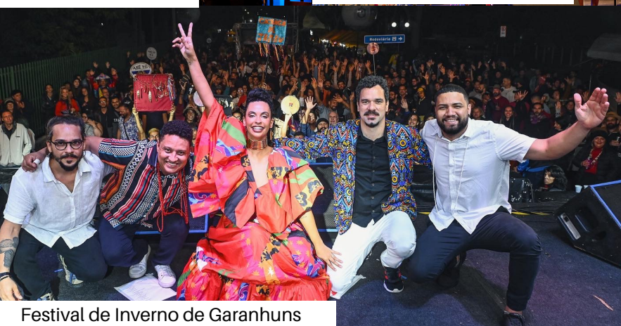
Festival de Inverno de Garanhuns