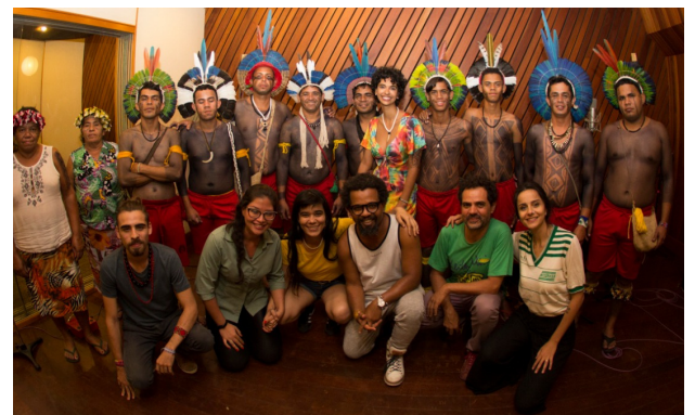
Grupo Sabuká Kariri Xocó