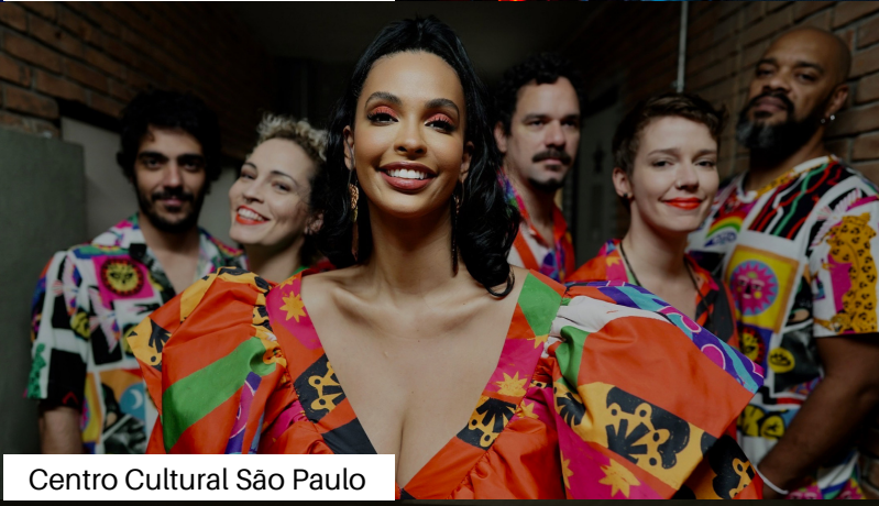
Centro Cultural São Paulo