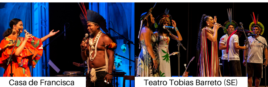
Casa de Francisca